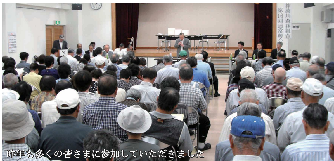
昨年も多くのお客さまに参加していただきました

森林組合へ提出してください。 町外在住者は、総会案内に同封の返信用封筒をご利用のうえ、総会前日までに森林組合へ届くよう投函してください。