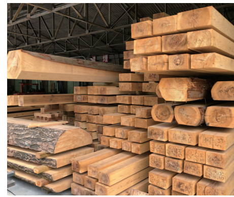
↑ 8 m材や太鼓梁、六角形の柱も挽けます。天日乾燥も棟梁のこだわり。

機械が老朽化した製材所は、大手製材所と競争もできず、廃止が検討されていました。改善の切っ掛けは、「住宅産業研修財団」が運営する『大工志塾』の研修を受け入れたことに始まります。