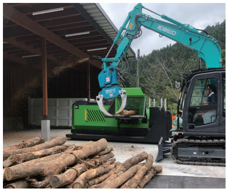
↑ 中型可搬式のチップパー。能力は10 m 3 /h以上。町内でのチップ消費量を増やすことで活用増。

高く販売できるようにします。材の流れや価格などは、チラシのとおりですが、価格は時期によって変動するため、持ち込む際は、お問合せください。